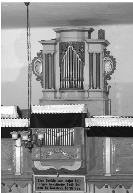
3. ábra: Árpástó egykori orgonája, ma az értarcsai református templomban (ismeretlen mester, I/5, 1800 előtt).

Mivel a reformátusok elsősorban a szász gyülekezetektől vásároltak orgonákat, hasznos lenne ilyen kutatást végezni a szász evangélikus egyházban is. Az egyházak egymás közötti kapcsolatának a XVIII–XIX. században lényeges, sok esetben egyetlen tárgya volt az orgonák adás-vétele, ezért kijelenthetjük, hogy teljes képet csak akkor kapunk az erdélyi orgonaépítészetéről, ha a nyugati kereszténységhez tartozó mindegyik erdélyi történelmi egyházban végbemegetjük az orgonák hasonló kutatása. 5 Így nemcsak az itt épített orgonákról és orgonaépítő mesterekről kapnánk több adatot, hanem kiteljesedne az erdélyi református orgonatörténet is az ide került hangszerek „előtörténetének” ismeretével. Legyen e munka előrelépés e feladatban!