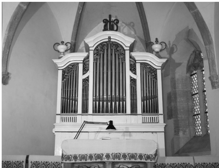
1. ábra: A gernyeszegi orgona (Samuel Binder, I+P/9, 1854).